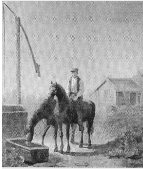
Hästarna vattnas. Målad i olja på duk i Tranemåla 1855 av Bengt Nordenberg. Flyttad till Gungvala gård.